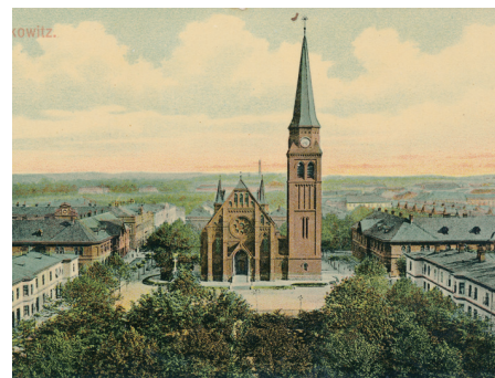
Vítkovické náměstí okolo roku 1905.

Sobota 1. dubna od 10 do 11.45 hod. Komentovaná vycházka se zaměří na dominanty závěrečné etapy vzniku Nových Vítkovic, která se soustředila zejména na výstavbu kolonií (kolonie Kairo, kolonie Jámy Louis, Josefínská kolonie, Mistrovská kolonie, Sirotčí kolonie). Právě kolonie budou v hlavním hledáčku průvodce. Přiblížíte si